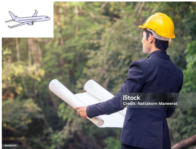
2. Retour des bipèdes