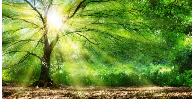
1. Harmonie retrouvée