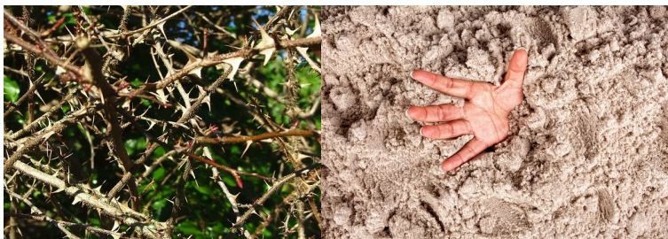
4. Préparation de la défense